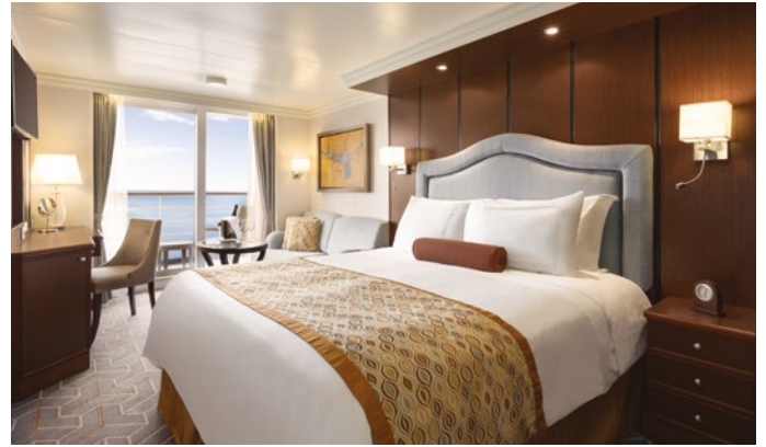
Camarote Concierge Veranda