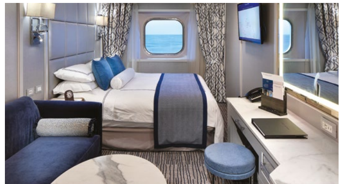
Camarote Deluxe con vista al mar

Mobiliario hecho a medida, acabados de piedra exótica, cabeceros tapizados e iluminación elegante son sólo algunas de las mejoras en estos camarotes de 20 metros cuadrados.