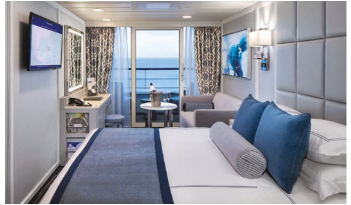
Camarote Concierge Veranda