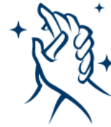
CLEANING & DISINFECTING

Aunque los protocolos continúan cambiando, en este momento se requiere que los pasajeros usen