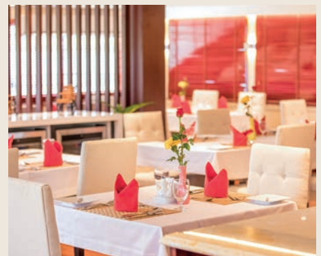
RESTAURANTE, RV LAN DIEP