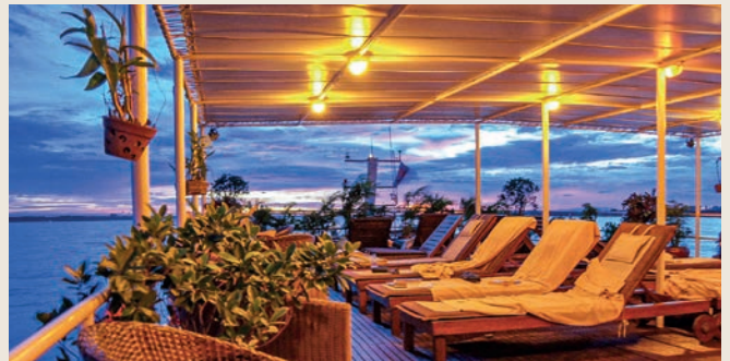
PUENTE SOL, RV TOUM TIOU II

Combina a la perfección intimidad y encanto. El revestimiento de madera exótica de sus 14 camarotes le confiere un estilo antiguo y un ambiente único.