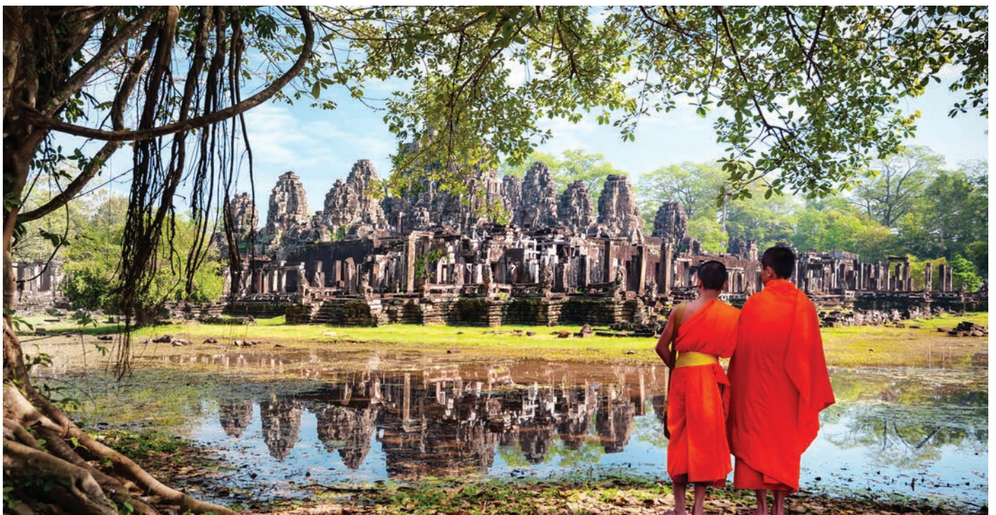
TEMPLO BAYON EN EL CORAZÓN DE ANGKOR THOM

(2) Dependiendo de la altura de las aguas del lago Tonlé, la travesía se puede realizar a bordo de su crucero o de una lancha rápida.