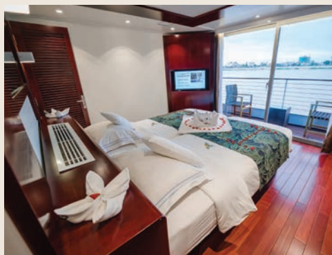
CAMAROTE, RV INDOCHINE II