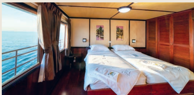
CAMAROTE, RV INDOCHINE

Situado en la cubierta superior, el restaurante, en el que se sirven todas las comidas, ofrece una cocina delicada en un ambiente refinado, donde los grandes ventanales permiten aprovechar al máximo las vistas panorámicas.