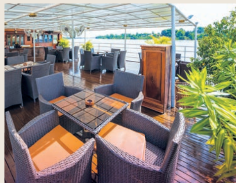
PUENTE SOL, RV INDOCHINE II