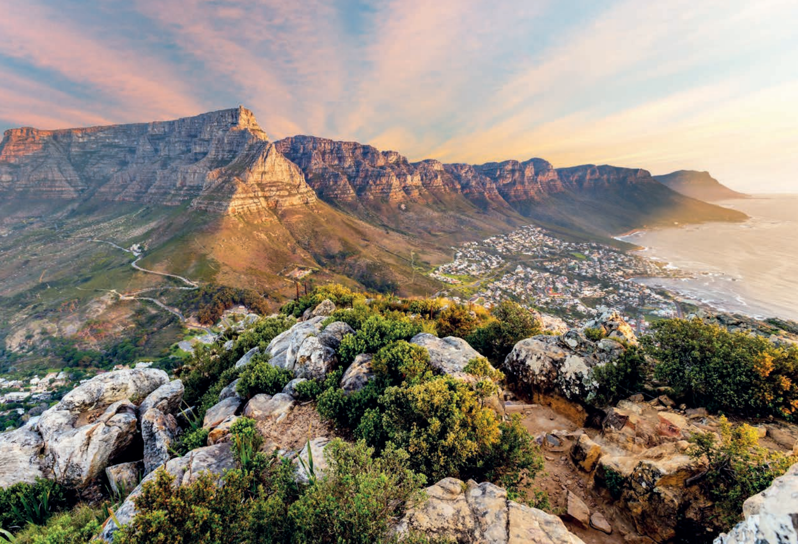
MONTAÑA DE LA MESA