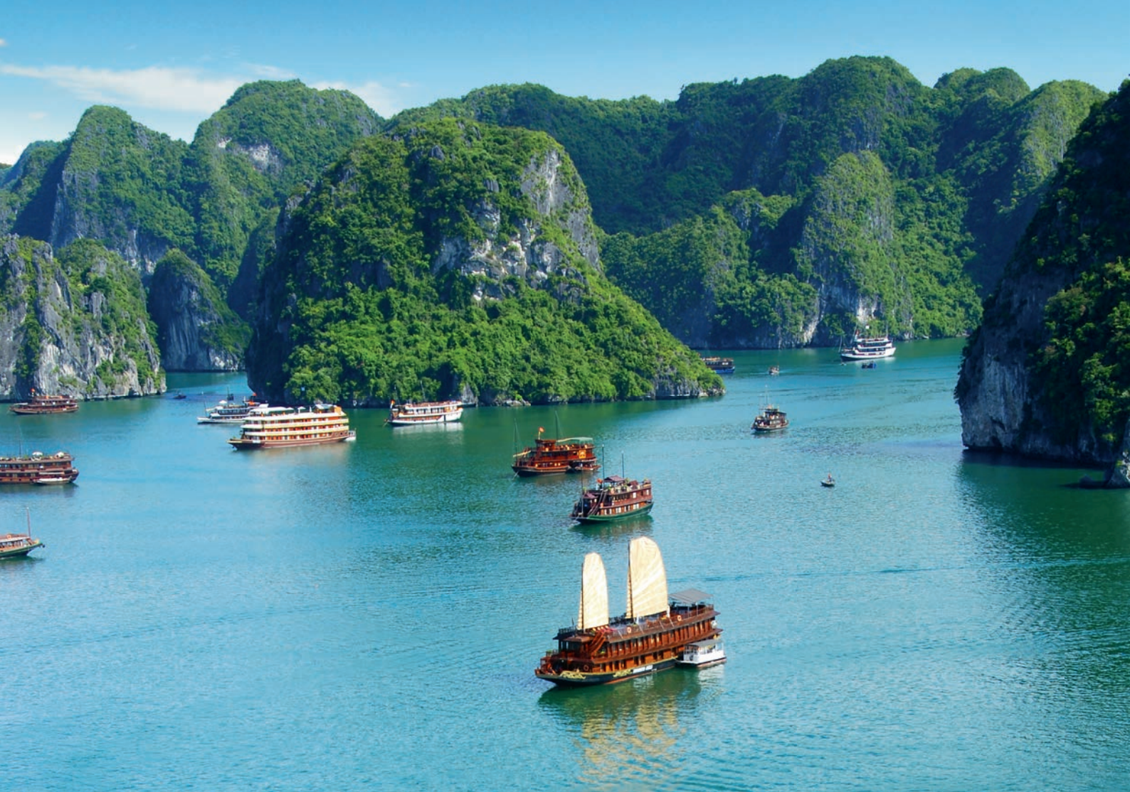
BAHÍA DE ALONG