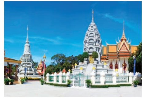
PHNOM PENH, PALACIO REAL Y SU PAGODA DE PLATA

Visita de la antigua casa de amante de la novelista francesa Marguerite Duras. Almuerzo a bordo y navegación en dirección a Vinh Long. Paseo en barco a través de los canales. Descubrimiento de una fábrica de ladrillo, y de la fabricación artesanal de arroz inflado y tortas de arroz, y también licor de arroz*. Regreso a bordo y navegación. Cena y noche a bordo.